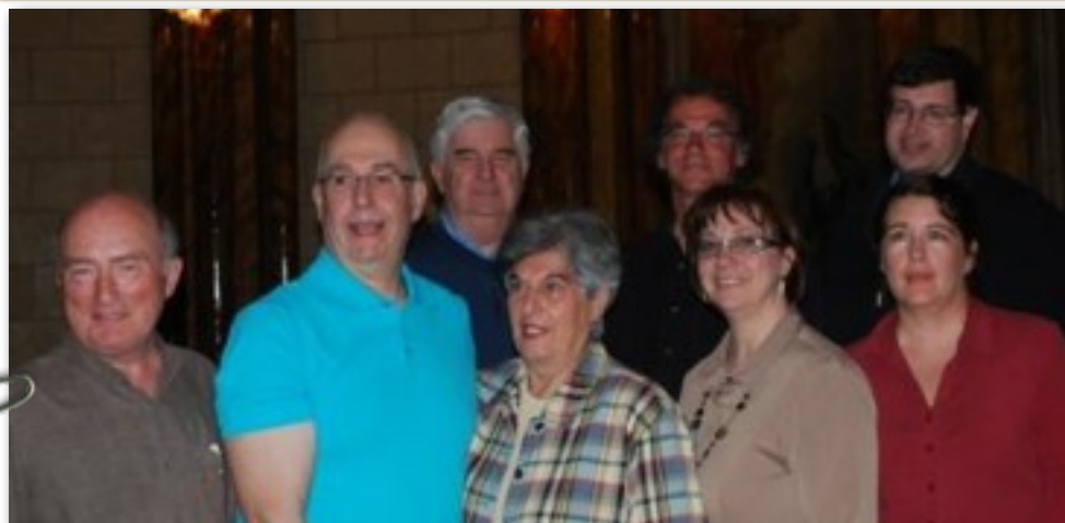
Conseil d'administration élu pour l'année 2011-2012