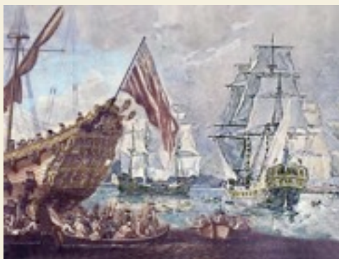
Bataille de la Ristigouche, 3 juillet 1760. Dernière bataille navale franco-britannique de la Guerre de Sept-Ans.