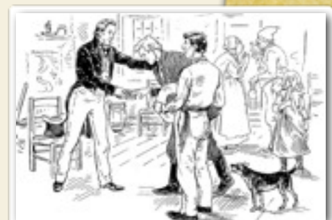
Serment des Frères chasseurs (dessin de Henri Julien)