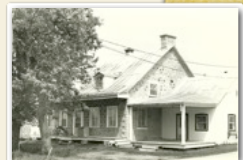
La maison Étienne Forget vers 1975

En janvier 1837, la maison était subdivisée en une salle commune, une grande chambre et une petite chambre. Au grenier, on remisait divers de grains de céréales, des tissus, des meubles et des outils. À la cave, on conservait 40 minots de patates; on y retrouvait aussi deux saloirs (pour le salage du porc) et une tinette de beurre.