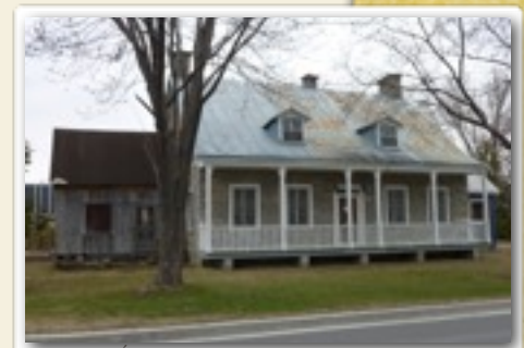
La maison Étienne Forget aujourd'hui