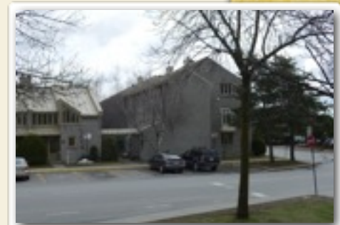
Place du moulin : 2 e emplacement de Charles Biron.

En 1744, ce même Régimbal s'était endetté sur billet auprès de deux négociants huguenots de Québec : il devait 1900# à