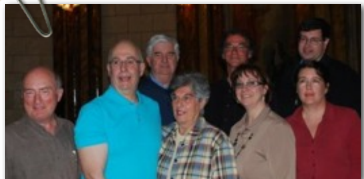
Conseil d'administration de la SHRT pour l'année 2011-2012

La Société d'histoire dévoile son programme de conférences de l'automne 2011. Pour la programmation complète, consulter le site internet http://www.shrt.qc.ca/calendrier1112.html