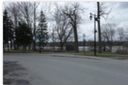
Emplacement du magasin de Charles Biron