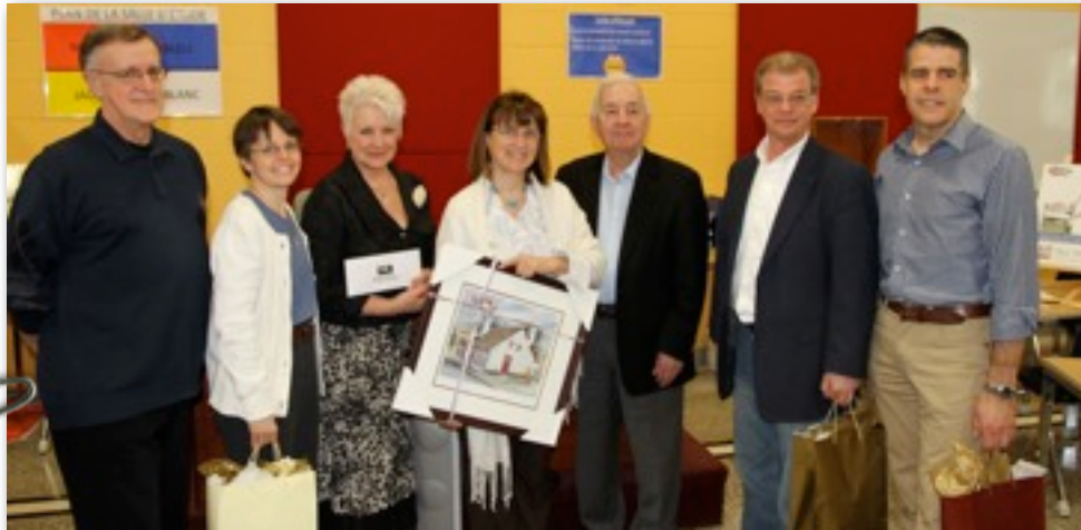
Gagnants des prix de présence lors du brunch-bénéfice en compagnie de l'historien Jacques Lacoursière